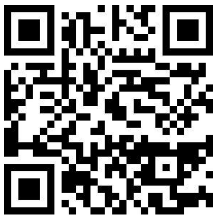
一站式信息服务大厅二维码（手机微信扫码使用）

点击“账号激活”，在提示页面填写个人信息，激活个人账号。本次激活后，后期不再需要重复激活。